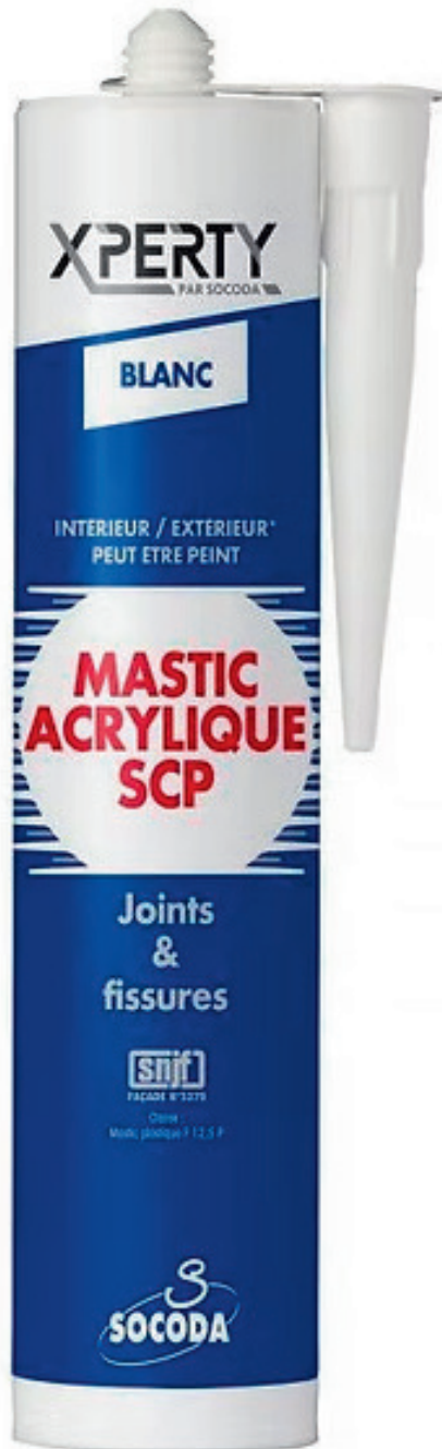
MASTIC ACRYLIQUE BLANC 310 ML Réf. 12505027