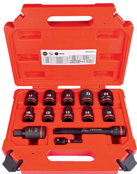
COFFRET DE DOUILLES SHOCKWAVE 1/2 DOUILLE SHOCKWAVE 1/2 COURTES SET 11 PCS - Coffret Réf. MIL4932480456