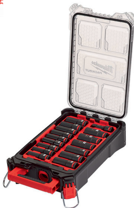
COFFRET DE DOUILLES SHOCKWAVE 1/2 LONGUE DOUILLE SHOCKWAVE 1/2 LONGUE SET 16 PCS PACKOUT - Coffret Réf. MIL4932480943