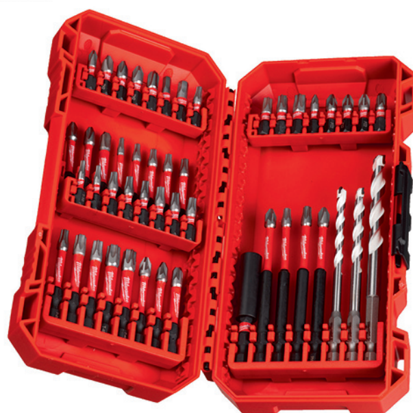
COFFRET 48 EMBOUTS DE VISSAGE COFFRET 48 Embouts de vissage Shockwave Impact Duty™ Réf. MIL4932492005