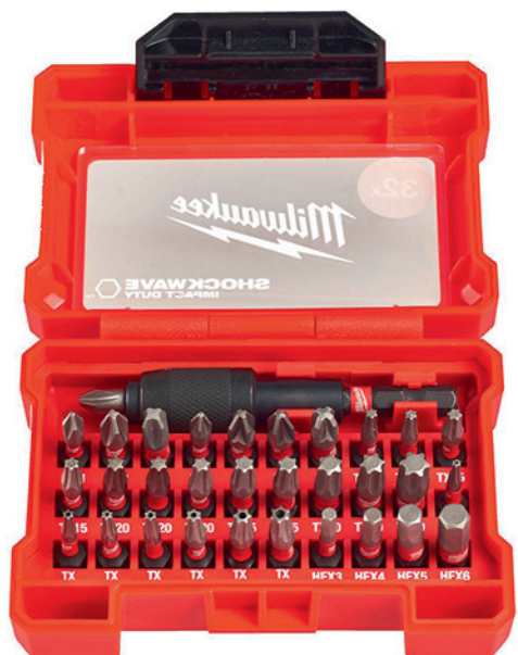
COFFRET 32 EMBOUTS DE VISSAGE COFFRET 32 Embouts vissage Shockwave Impact Duty™ Réf. MIL4932464240