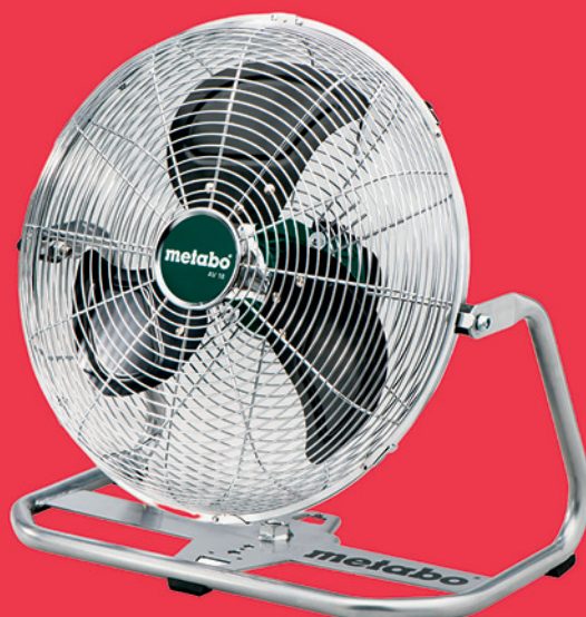
VENTILATEUR 18 V AV 18 Ventilateur 18 V AV 18 Pick+Mix (sans batterie ni chargeur), carton. Réf. MET606176850