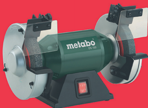
TOURET À MEULER DS 150 Touret à meuler DS 150 ; Puissance : 350 W ; Meule (Ø x épaisseur x perçage) : 150 x 20 x 20 mm Réf. MET619150000