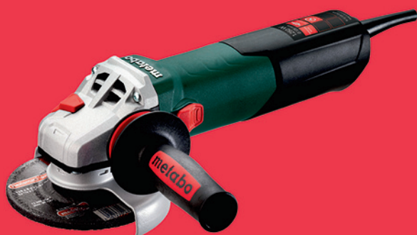
MEULEUSE 125 MM W 12-125 QUICK Meuleuse 125 mm W 12-125 Quick, Puissance : 1200 W Réf. MET600398000