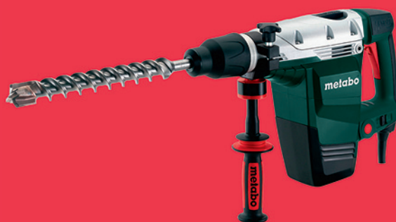
MARTEAU PERFORATEUR BURINEUR SDS MAX KHE 56 Marteau perforateur burineur SDS Max KHE 56 Coffret, Puissance : 1300 W ; énergie de frappe max par coup : 8.5 J. Réf. MET600340000